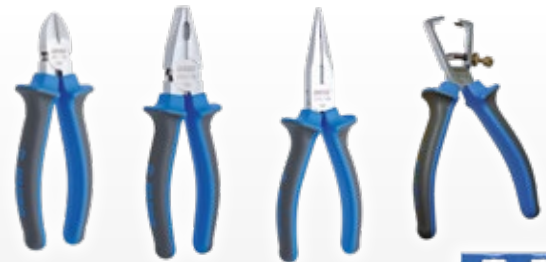
Zangenset 402 C2