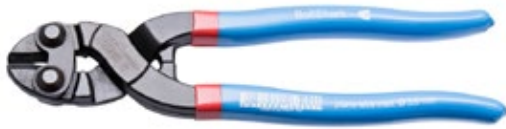
BoltShark 200“ 469SHARK/4DP nach DIN ISO 5743

Für präzises schneiden von Drähen von 6,0 mm, (weicher Draht), bis 4,0 mm (harter Draht), bis 3,5 mm (Piano-Draht)49