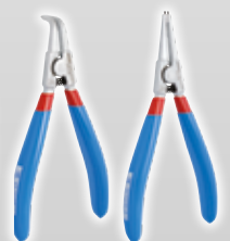
Sicherungsringzangenset 539PLUS/1DPCT, 180 mm

621625 4-tlg. 532/534/536/538 in Kunstledertasche 99,90