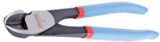
„PowerShark 250“ 467SHARK/4DP nach DIN ISO 5743

Mittig angeordnete Schneidbacken, präzise, dauerhafte Schneidleistung bei geringem Kraftaufwand